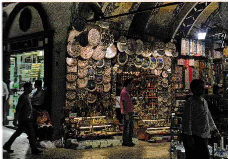
Foto: Stand în Marele Bazar

Chiar dacă muzeele militare nu se înscriu în lista preferințelor dumneavoastră, puteți vizita Askeri Müzesi fie și numai pentru a asista la spectacolele de muzică tradițională militară pe care prima formație de acest gen din lume – Mehter Takımı (Trupa Ienicerilor) – le dă din când în când aici.