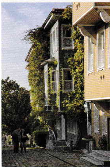
Jos: Strada Soğukçeşme din Sultanahmet

Indiferent cât timp aveți la dispoziție, nu vă privați de plăcerea unei croazieră pe Bosfor. Vi se va deschide o altă perspectivă asupra orașului și veți descoperi suburbiile sale, cu moschei, palate, fortărețe, yalılar și parcuri.